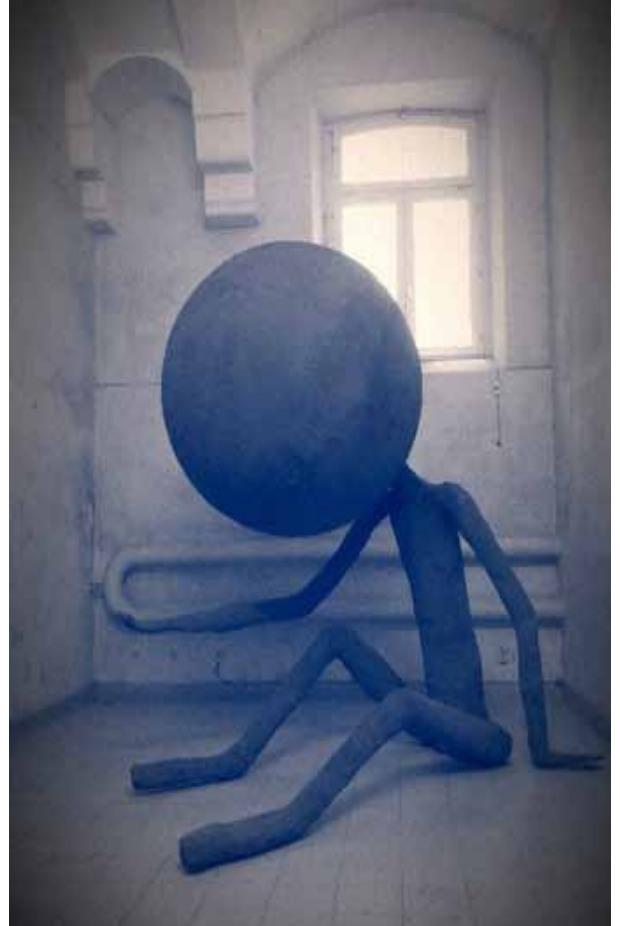
Gloria Friedman, Le cobaye , 2014. « La survivance des lucioles », Avignon 2014, maison d'arrêt de Saint-Anne reconvertie en musée.

Georges Didi-Huberman, Survivance des Lucioles , 2009.