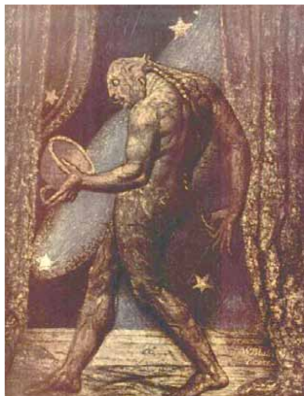
William Blake, The Ghost of a Flea .

Blake, l'enfant qui s'écriait « Dieu a passé la tête à la fenêtre ! », et qui dans les champs voyait un arbre étoilé d'anges ou des anges marchant parmi les moissonneurs, se faisait battre par ses parents pour avoir menti ; déjà adolescent, celui qui maria le ciel et les enfers, percevait les images qui se formaient à l'arrière-plan de sa conscience aussi nettement que les choses du dehors.