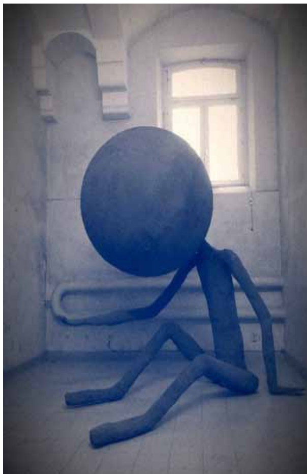
Gloria Friedman, Le cobaye , 2014. « La survivance des lucioles », Avignon 2014, maison d'arrêt de Saint-Anne reconvertie en musée.

Georges Didi-Huberman, Survivance des Lucioles , 2009.