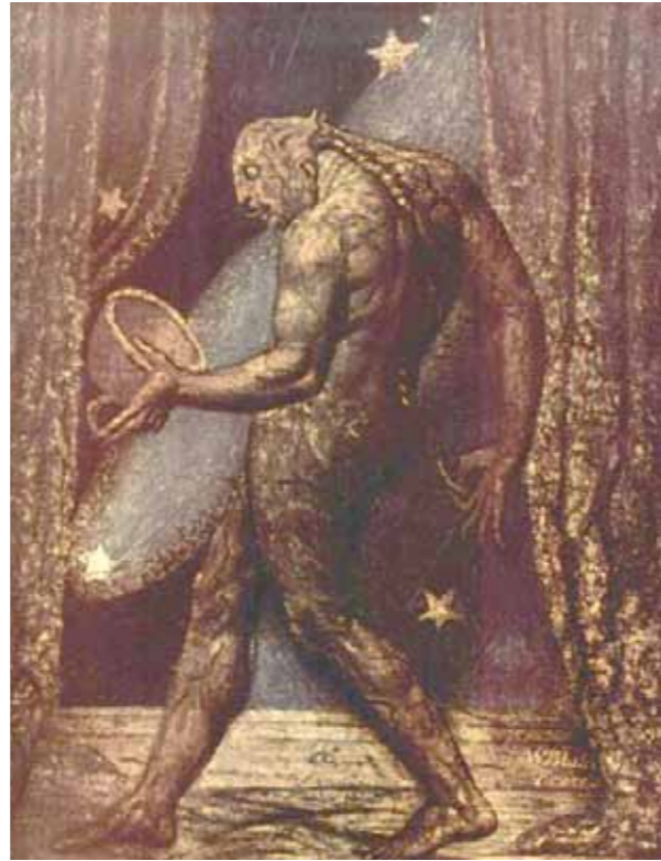
William Blake, The Ghost of a Flea .

Blake, l'enfant qui s'écriait « Dieu a passé la tête à la fenêtre ! », et qui dans les champs voyait un arbre étoilé d'anges ou des anges marchant parmi les moissonneurs, se faisait battre par ses parents pour avoir menti ; déjà adolescent, celui qui maria le ciel et les enfers, percevait les images qui se formaient à l'arrière-plan de sa conscience aussi nettement que les choses du dehors.