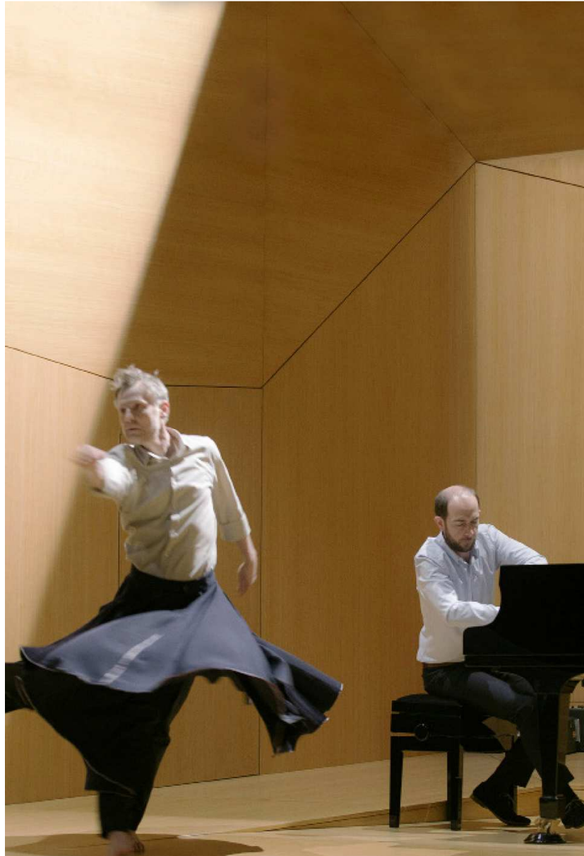
La Fonction Ravel