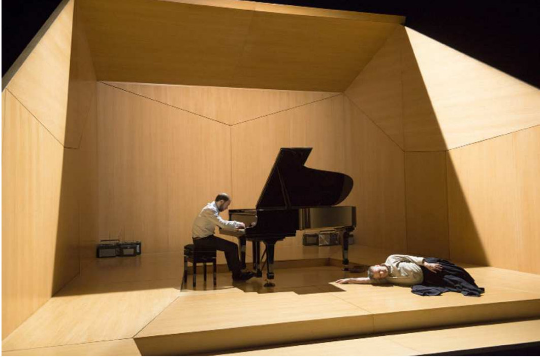
La Fonction Ravel