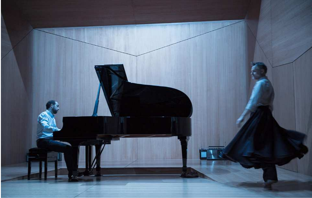
La Fonction Ravel