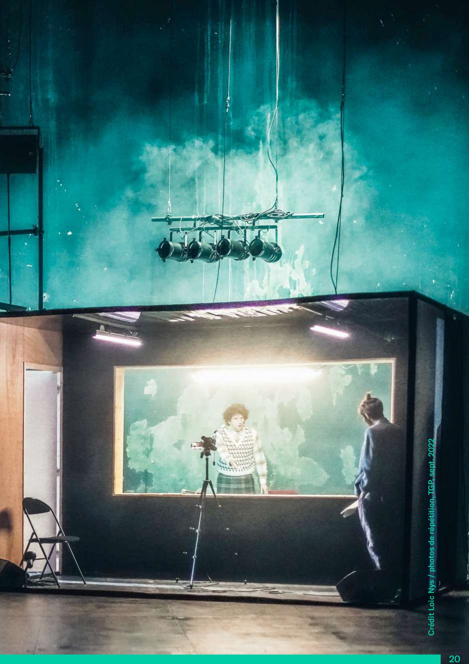
photos de répétition, TGP, sept. 2022