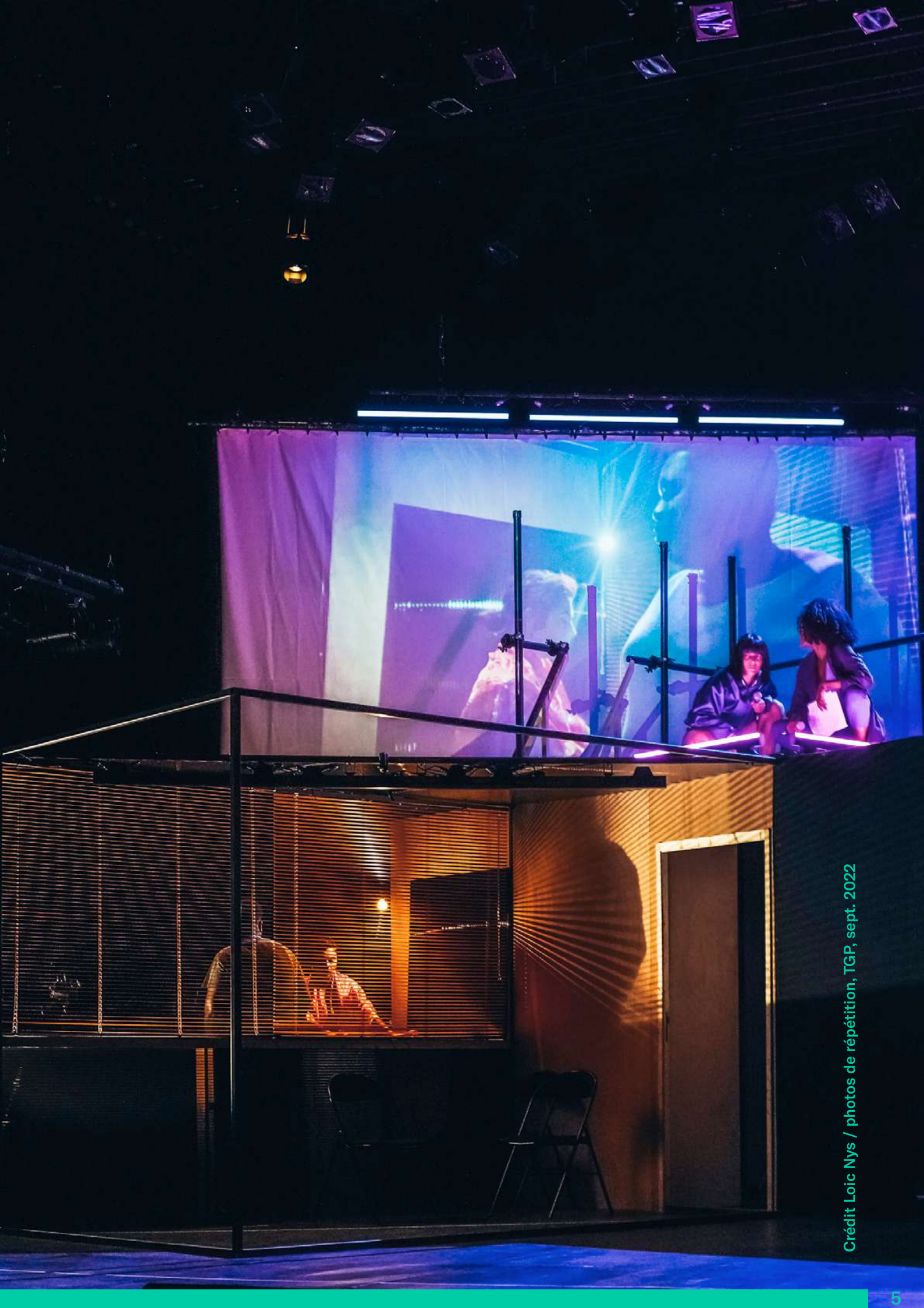
photos de répétition, TGP, sept. 2022