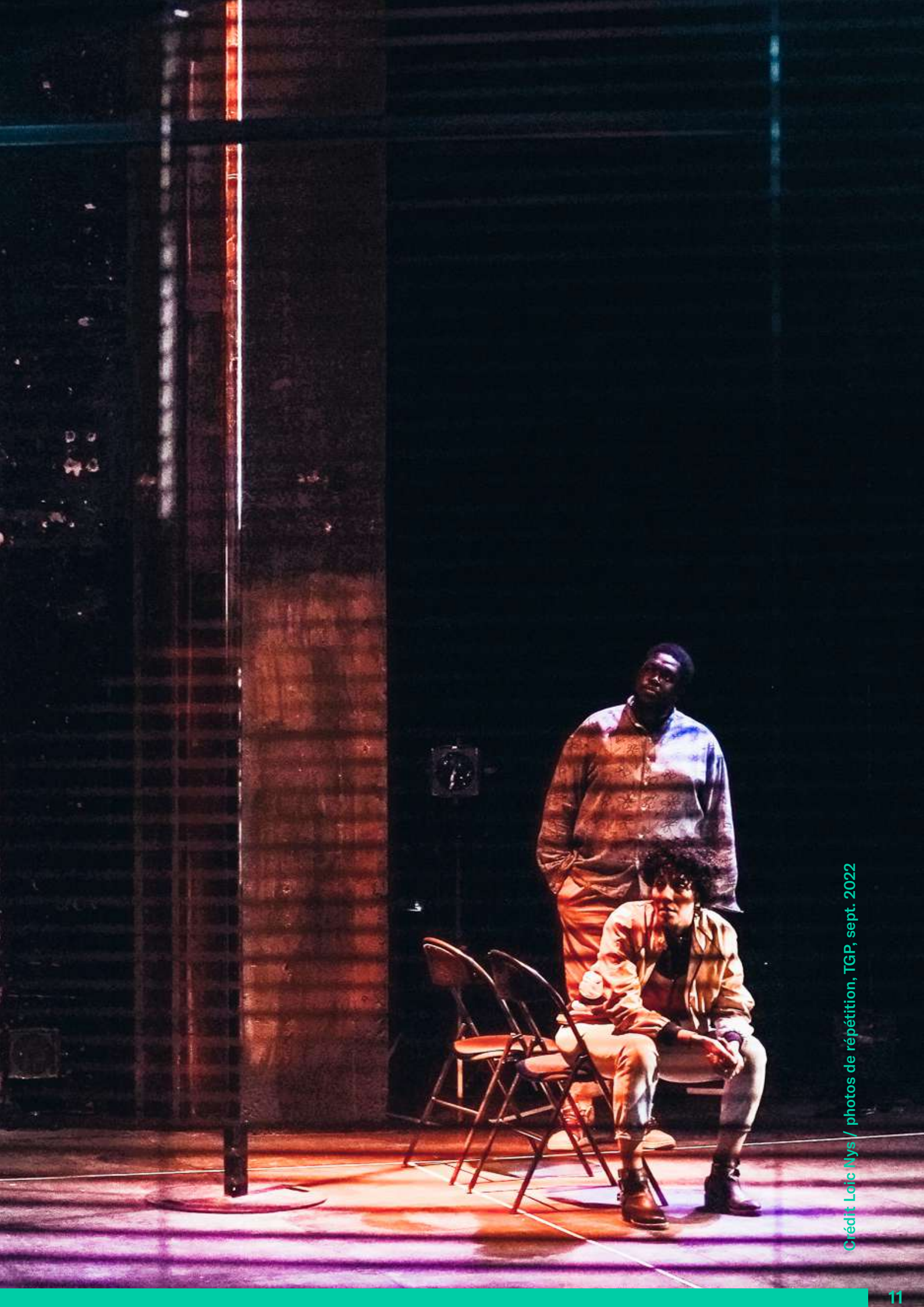
photos de répétition, TGP, sept. 2022