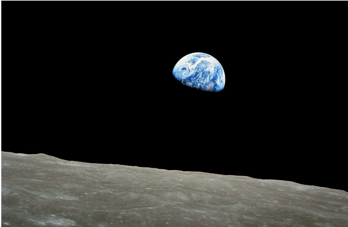
Earthrise , 1968

S'inscrire dans l'espace-temps de l'univers c'est sortir d'un espace-temps de terrien-ne, d'un espace-temps de mortel-le, c'est se placer dans la relativité de la matière dont nous venons et où nous retournerons. C'est s'inscrire dans un cycle bien plus large que celui de notre existence et changer de perspective sur nos destins humains. Ce que l'on perçoit comme le réel du temps et de l'espace n'est plus. Cela permet un nouveau regard, un espace de liberté.