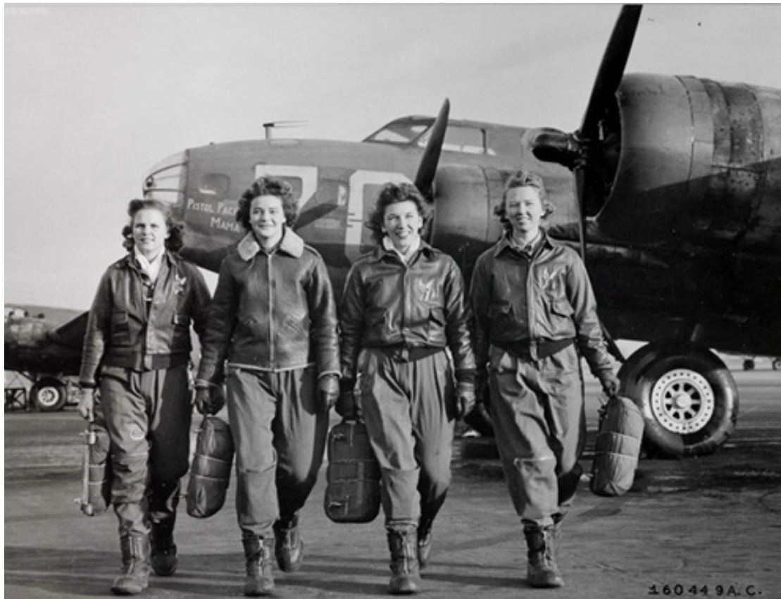
Pilotes faisant partie du WASP, Women Airforce Service Pilots, puis du programme Mercury 13, 1944