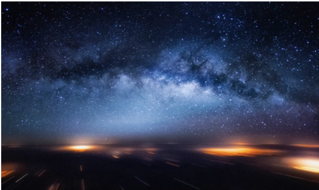
La voie lactée au-dessus des métropoles indiennes

Vivre avec le trouble , Donna Haraway, 2016